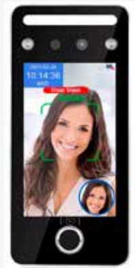
FLEXiA Network TF11