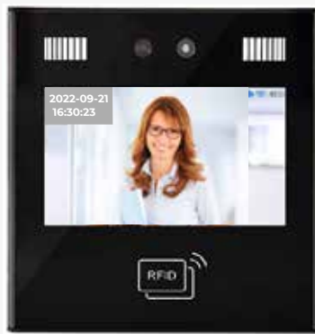
FLEXiA Network TF21