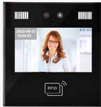
FLEXiA Network TF21