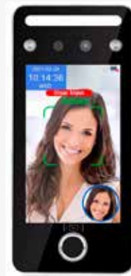
FLEXiA Network TF1