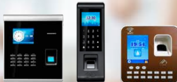
GIOMAX Network PROBIO GIOMAX Network BIOPRO XC GIOMAX Network BIOPRO PLUS

Reconocimiento por lectura óptica de huella Proximidad