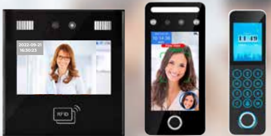
FLEXiA Network TF21 FLEXiA Network TF11 FLEXiA Network TH31

Reconocimiento facial IA Huella capacitativa Proximidad