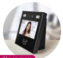
Colocación en mesa

Reconocimiento facial por Inteligencia Artificial (IA)