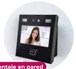
Montaje en pared